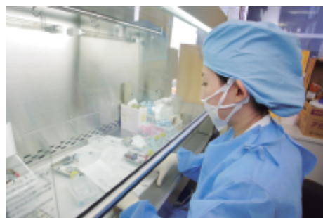
昭和大学病院薬剤部(無菌調剤)