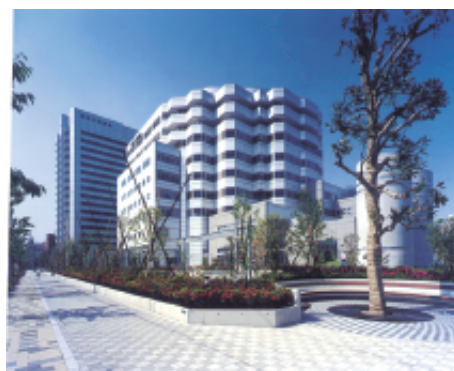
隣接する昭和大学病院